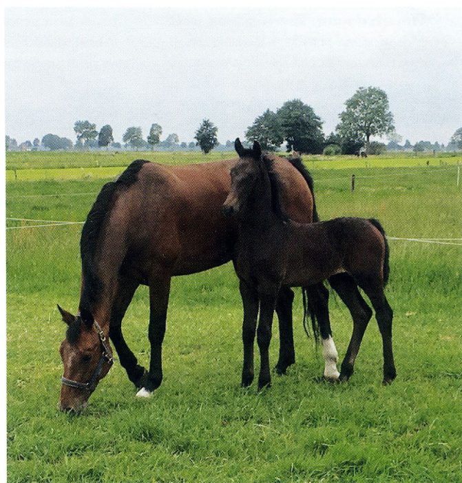
Moeder Helise met Magnifiek als veulen.