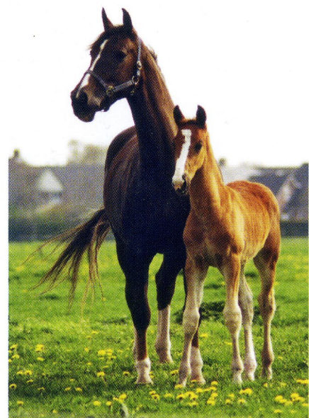
Overgrootmoeder Ilse (Cambridge Cole x Uriant x Locomotief)